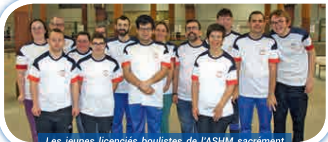
Les jeunes licenciés boulistes de l'ASHM sacrément fiers de porter le maillot bleu blanc rouge offert par le club sportif bouliste de Saint-Michel-de-Maurienne.