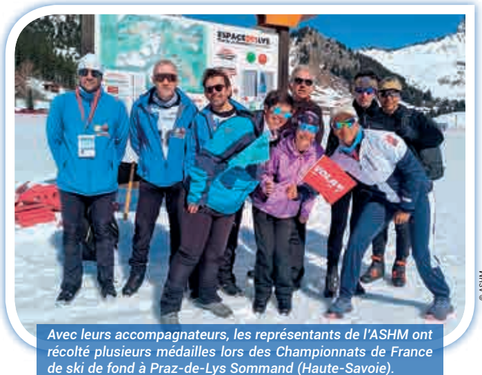
Avec leurs accompagnateurs, les représentants de l'ASHM ont récolté plusieurs médailles lors des Championnats de France de ski de fond à Praz-de-Lys Sommand (Haute-Savoie).